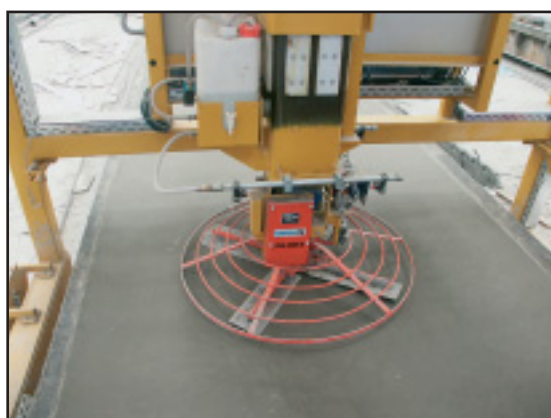
Лопастное выравнивающее устройство, детально