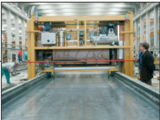
Очистительная, распылительная машина (RPE)