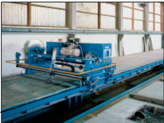
Конвейерный прибор для вычерчивания кривых (BEMР)