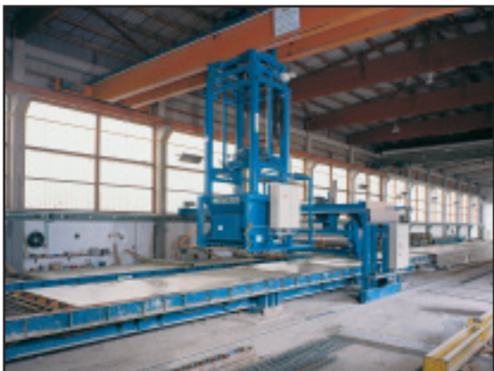
Бетонораздатчик на кране