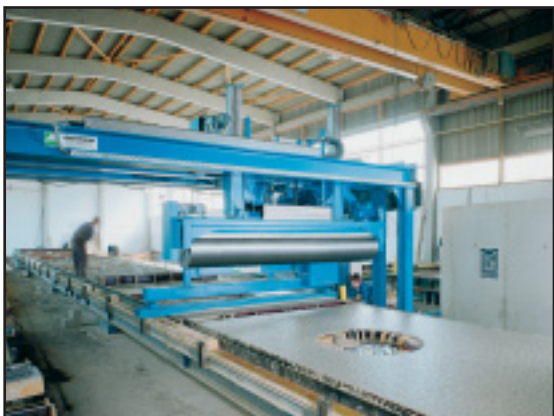
Выравнивающий брус и разравнивающий вал