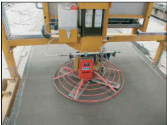
Лопастное выравнивающее устройство, детально