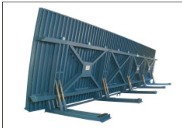
Гидравлический наклонный стол, например, 30 x 5 м (вид сзади)

При максимальной удельной нагрузке на единицу площади до 1000 кН/м 2 и применении высокочастотной вибрационной техники для качественного уплотнения бетона наклонные столы удовлетворяют самым высоким требованиям, предъявляемым к конструкции и динамике.