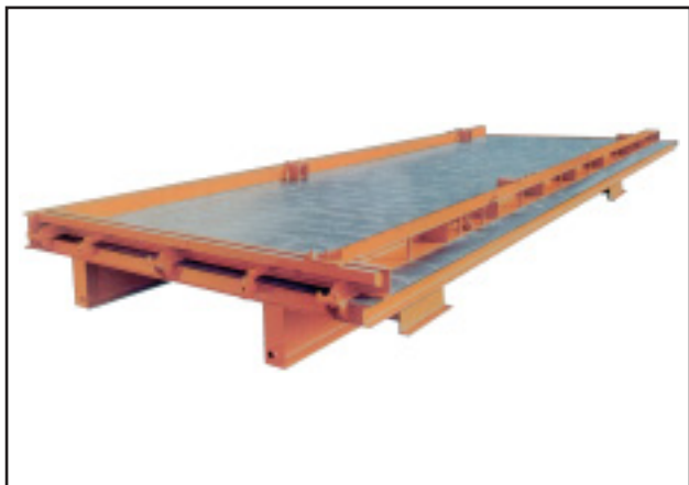
Система периферийной опалубки с бесступенчатым регулированием

Одиночный стол или комплексная тандемная конструкция, уникальная система периферийной опалубки и согласованная вибрационная техника – это фирменные знаки опыта и долговечности.